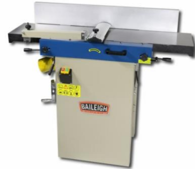
Jointer – Planer