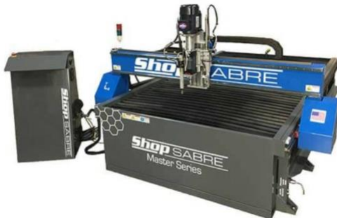
Shop Sabre CNC Plasma Machine*