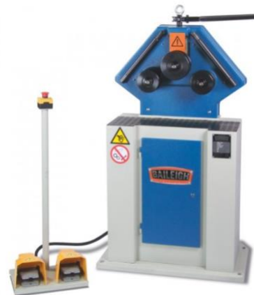
Ring Roll Bender