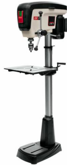
Woodworking Drill Press

Manual Adjustments Operating Controls Operation Drilling Holes – Through Drilling Holes – Part Way Cleaning + Maintenance