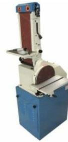
Belt Disk Sander

Manual + Safety Requirements Machine Operation Machine Overview