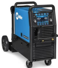
Millermatic 255 (MIG Welder)

Manual + Safety Requirements Key Features Weld Screen Setup Push-Pull Gun Setup Spool Gun Setup Flux-Cored Welding Machine Overview Machine Setup