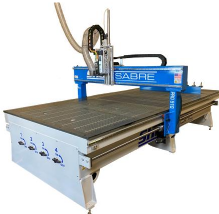
CNC Wood Router Table*