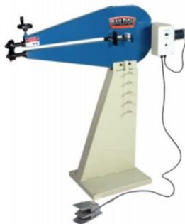
Metal Bead Roller

Manual + Safety Requirements Machine Operation Roller Installation/Removal Machine Overview