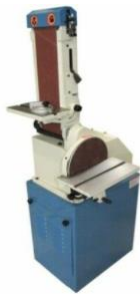
Belt Disk Sander