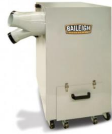
Metal Dust Collector

Manual Machine Operation Machine Overview