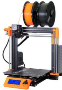
Prusa i3 MK3 3D Printer