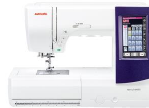
Janome Memory Craft 9850 Machine

Manual + Safety Requirements Software Installation Job Manager Laser Dashboard Control Panel Artwork Setup / Engraving + Cutting Engraving Materials Material Settings Machine Overview