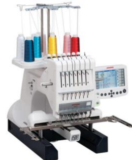
Janome MB-7 Embroidery Machine