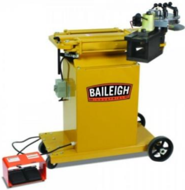
Rotary Draw / Tube Bender

Manual Die Selection + Installation Machine Overview