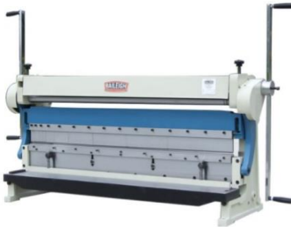
3 – in – 1 Shear, Brake, and Roll

Manual + Safety Requirements Machine Operation Machine Overview