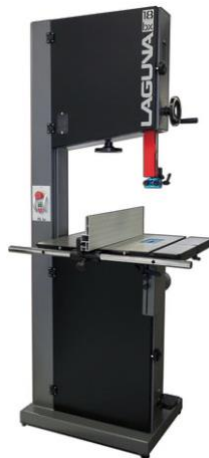
Wood Band Saw

Manual Adjustments Operating Controls Operation Drilling Holes – Through Drilling Holes – Part Way Cleaning + Maintenance