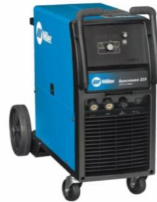
Synchrowave 210 (TIG Welder)

Manual Capability Quick Reference Welding Tips Machine Overview