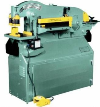
Piranha Iron Worker