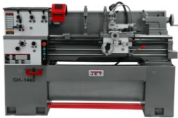
1440 Metal Lathe

Manual + Safety Requirements Machine Overview