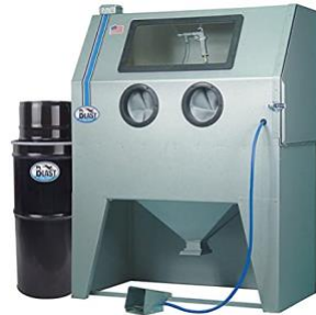
Dry Blast Cabinet

Manual + Safety Requirements Troubleshooting Siphon Gun Instructions