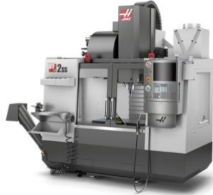
Haas VF2SS CNC Mill*