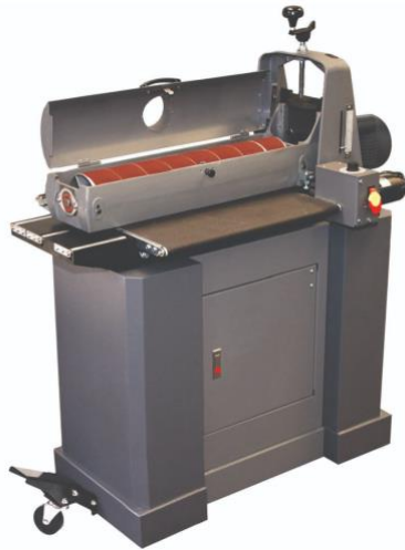
Wide Belt / Drum Sander

Manual + Safety Requirements Operation Changing Sandpaper