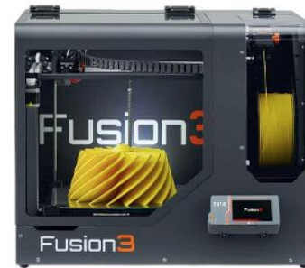
Fusion 3 F140 3D Printer

Prusa Knowledge Base Print Quality Troubleshooting Prusa Community Forum Intro to Prusa Slicer