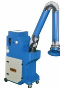
Welding Fume Extractor

Manual + Safety Requirements Machine Operation Roller Installation/Removal Machine Overview