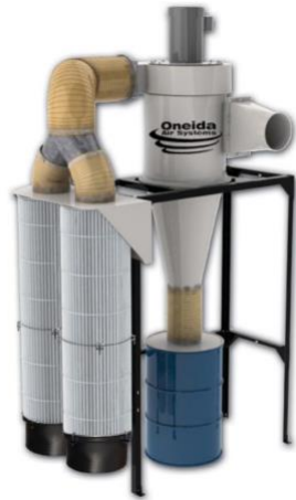
Direct Drive Dust Collector